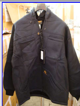
Felpa Termica Uomo Mod. 03 Vintage Made in Italy